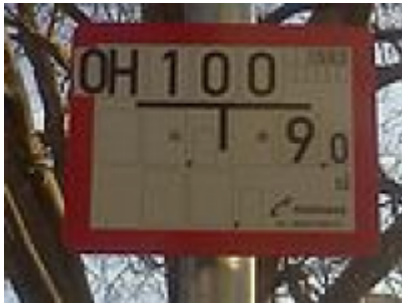
Hinweis auf einen Oberflurhydranten (OH) sowie den Betreiber (rechts unten Mainova)