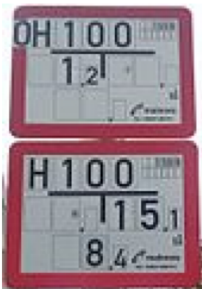
Hinweisschild auf Über- und Unterflurhydrantenschild in Frankfurt am Main