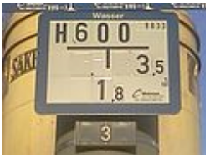
Blaues Hydrantenschild zum Hinweis, dass dieser Hydrant zusätzlich Be- und/oder Entlüftungseinrichtungen für die Leitungswartung besitzt