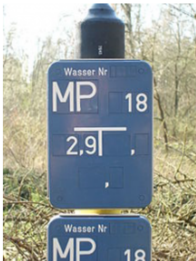
Hinweisschilder für Wassermesspunkte

Hinweisschild für den Schieber einer Leitung mit 40 Zentimeter Innendurchmesser (DN 400) bietet,